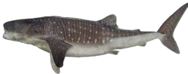
Tiburón ballena ② Whale shark Rhincodon typus