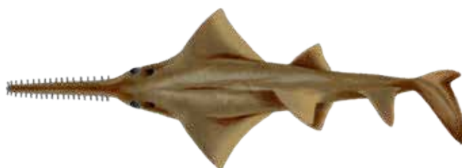
Pez sierra o catanuda ① Sawfish Pristis spp.

① Elaborado por el Blgo. Víctor Leonardo Cevallos Lucas