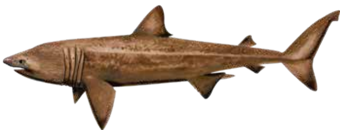
Tiburón peregrino ① Basking shark Cetorhinus maximus