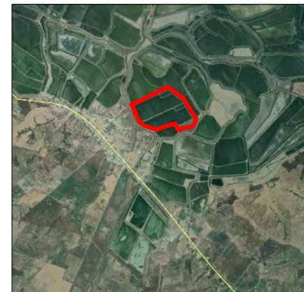
UBICACIÓN GEOGRÁFICA ESCALA: 1 - 50.000